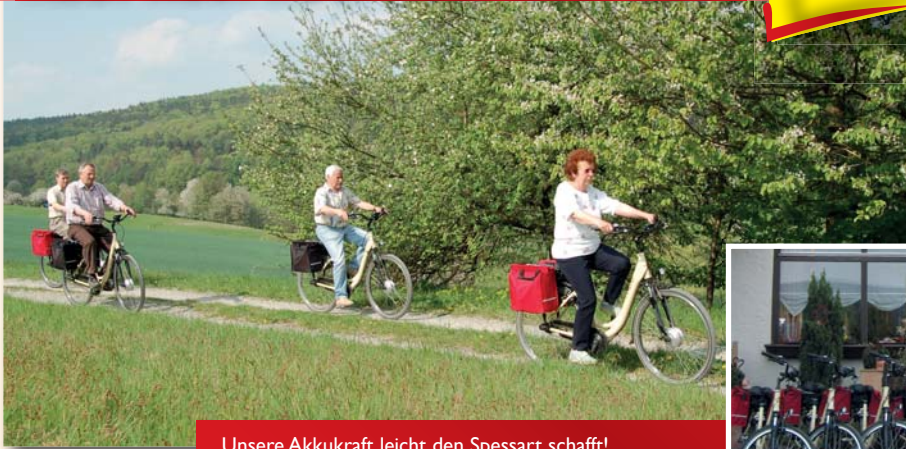
Unsere Akkukraft leicht den Spessart schafft!

Verleihpreis: 19,- Euro pro Tag und Fahrrad