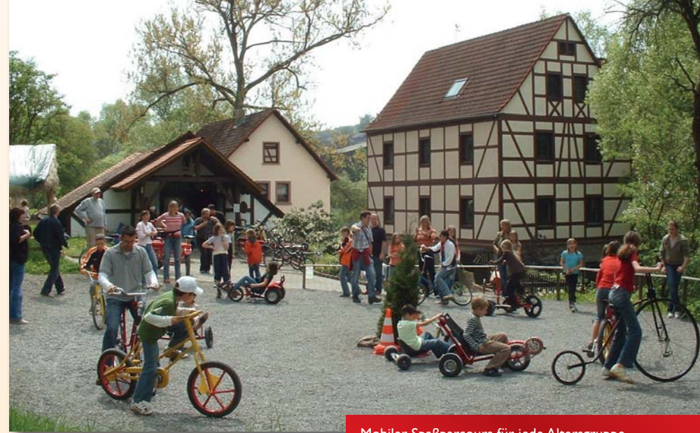
Mobiler Spaßparcours für jede Altersgruppe.